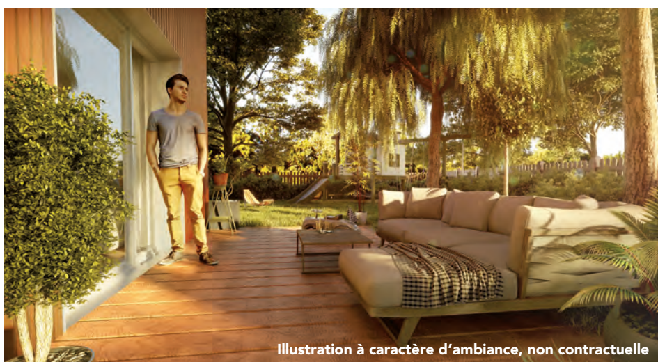
Illustration à caractère d'ambiance, non contractuelle

Nos logements garantissent une certification environnementale NF Habitat : > la qualité de vie, > le respect de l'environnement, > la performance économique, > la qualité de service.